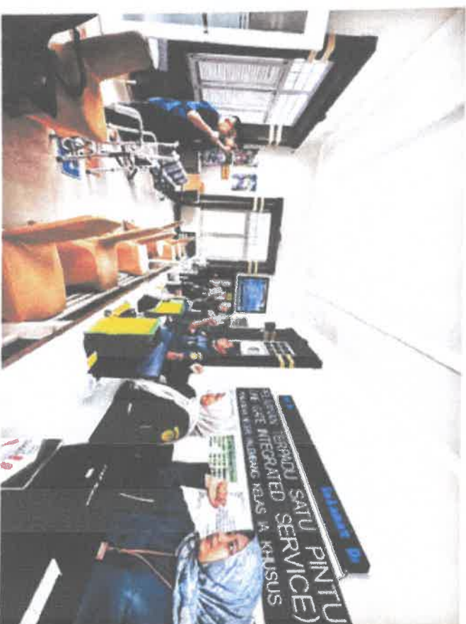
BRIEFING PETUGAS PTSP

Website : www.pn-palembang.go.id PALEMBANG