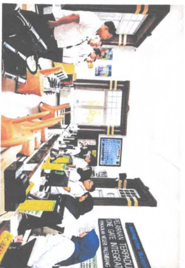
BRIEFING PETUGAS PTSP

Website : www.pn.palembang.go.id PALEMBANG